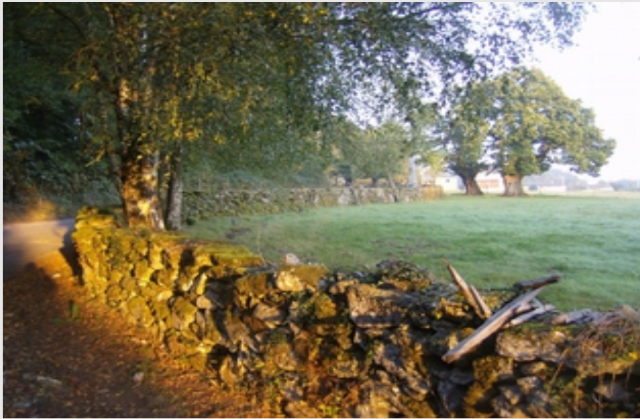
Chemin en Galice.