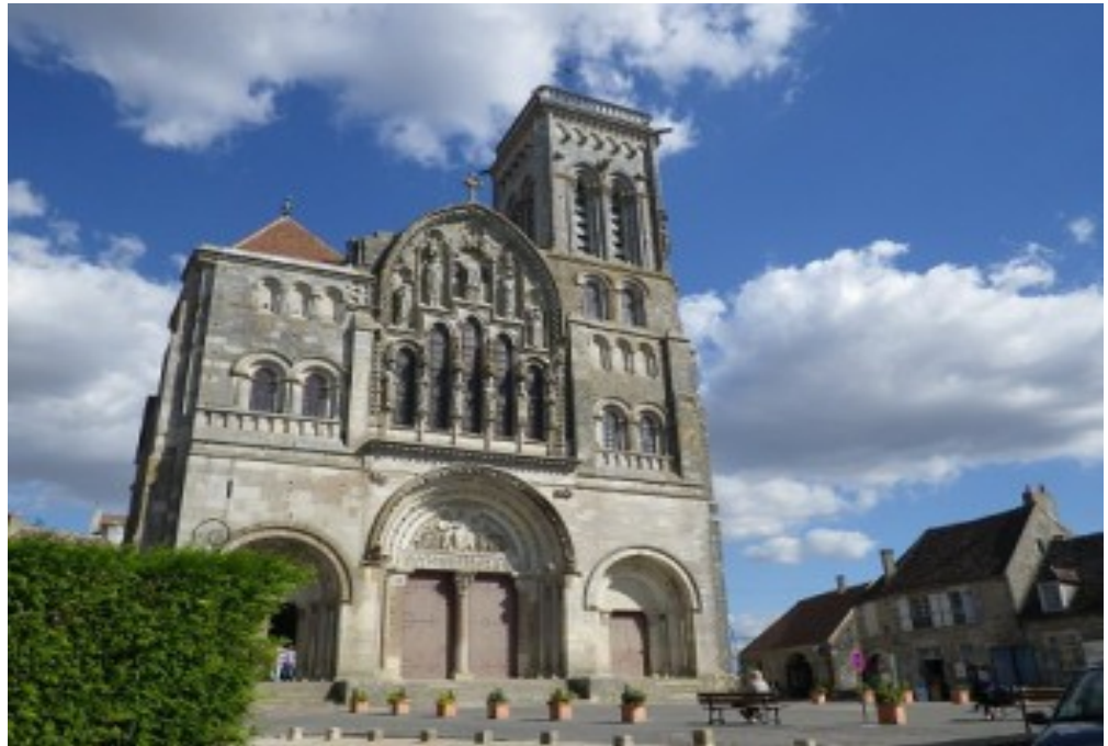
Basilique Sainte Marie Madeleine de Vézelay